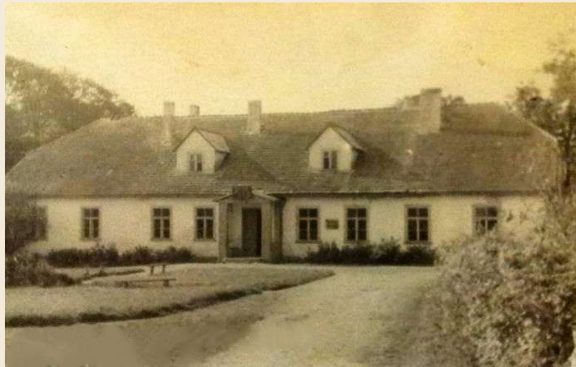
Kaunatavos dvaras (XX a.) Tarybiniais metais buvo pritaikytas mokyklos reikmėms