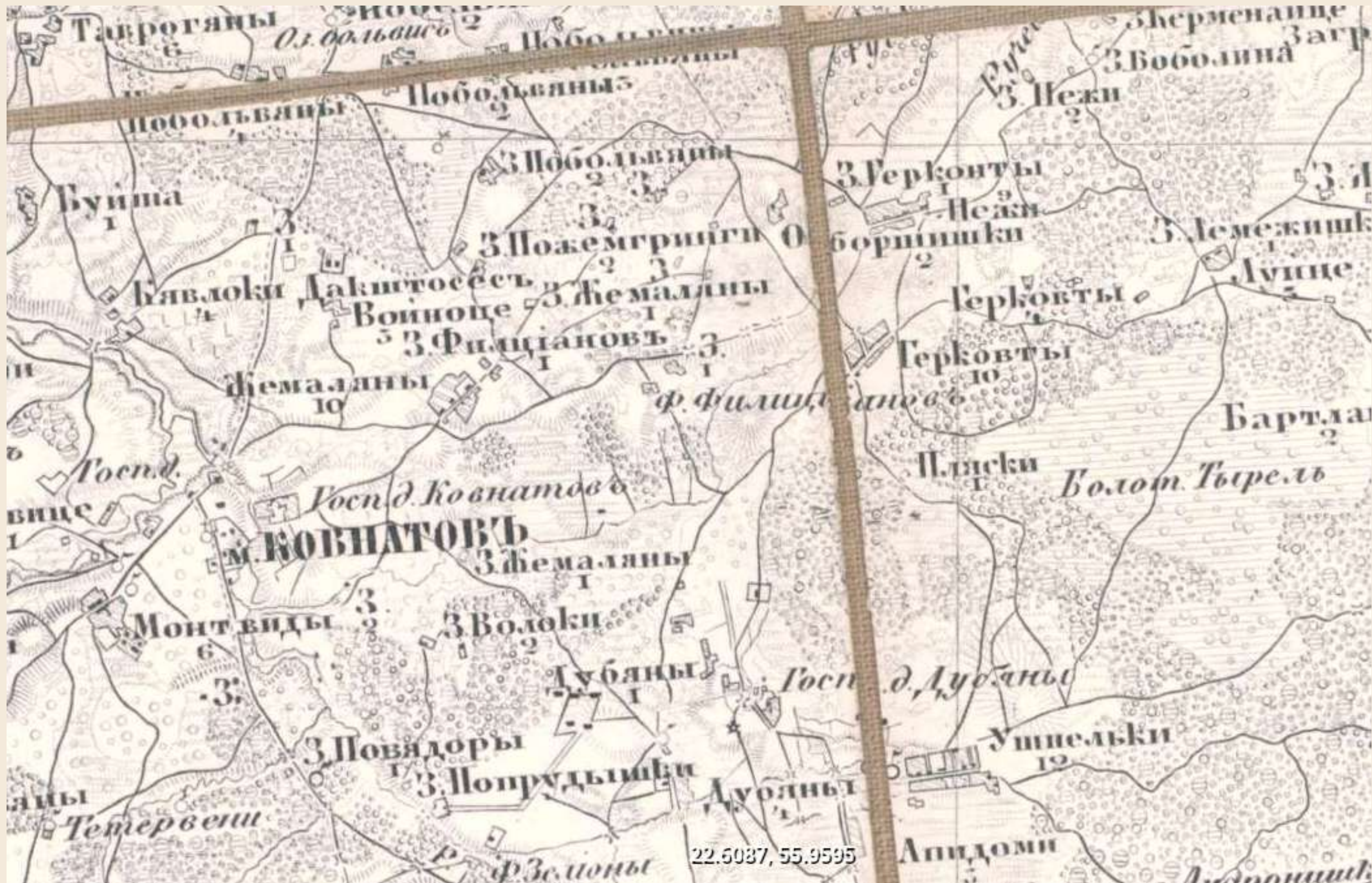
1872 m. Kauno gubernijos žemėlapis, kuriame pažymėta Kaunatava