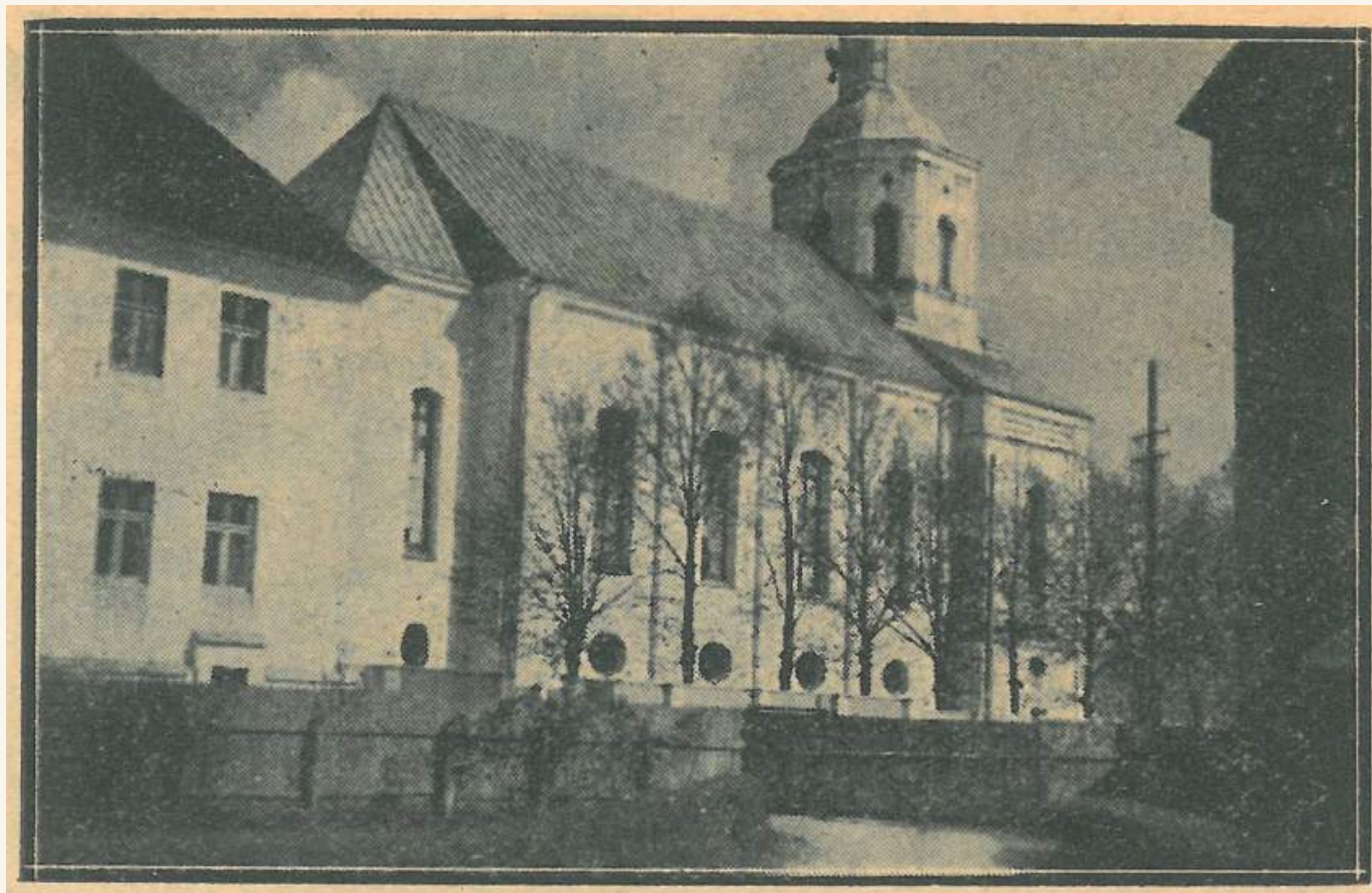
Telšių katedra 1936 m.