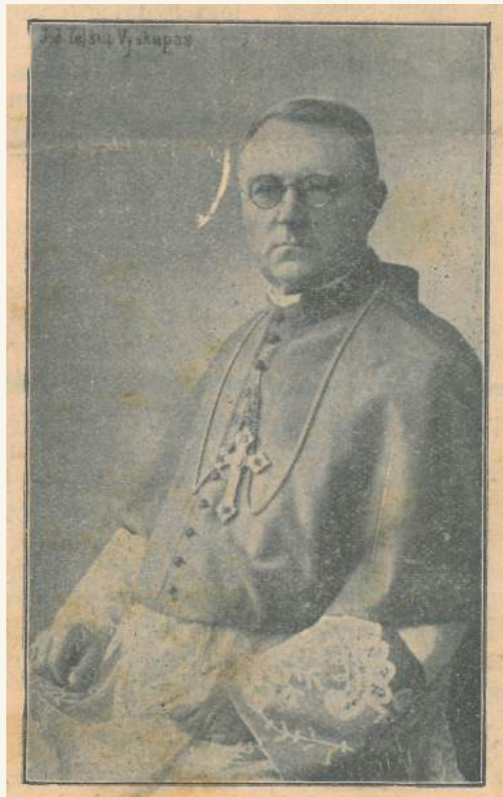
Telšių vyskupas Justinas Staugaitis 1929 m.