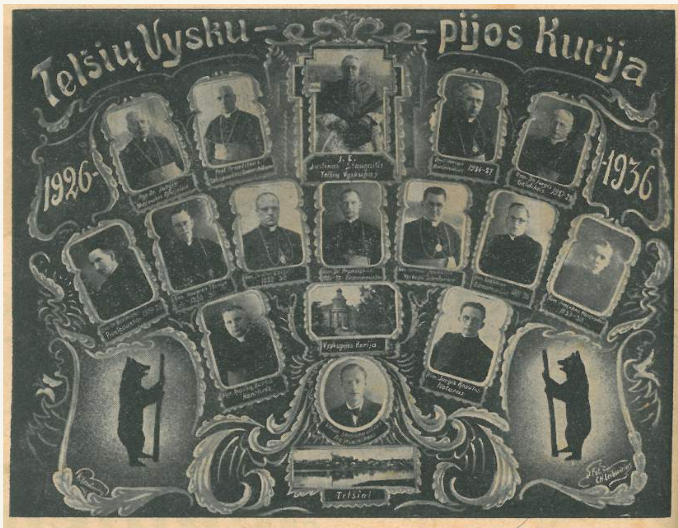
Telšių vyskupystės kurija švenčianti dešimtmetį (1926-1936)